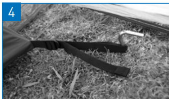
インナー下部手前のループをペグダウンして固定します。