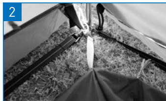
インナー下部のSフックを、奥のポール根元のリングにかけます。