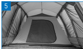
インナーの完成です。