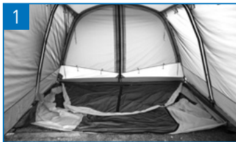
向きを確認し、インナーを広げます。