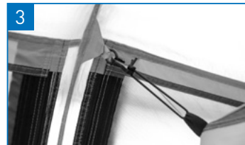
奥から順にインナーのフックを全てかけていきます。